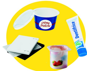
Pots et boîtes