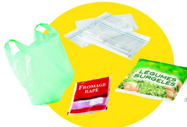
Sacs et sachets