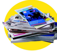
Papiers, journaux, magazines