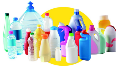
Bouteilles et flacons