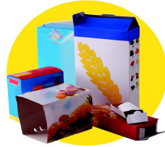
Emballages en carton